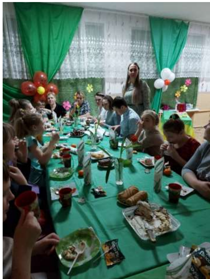
Родительский комитет 8 класса.