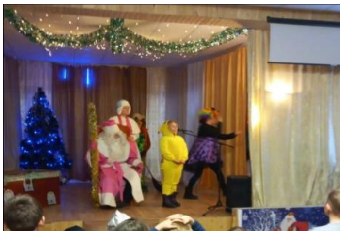
А также дети рассказывали стихотворения дед морозу.