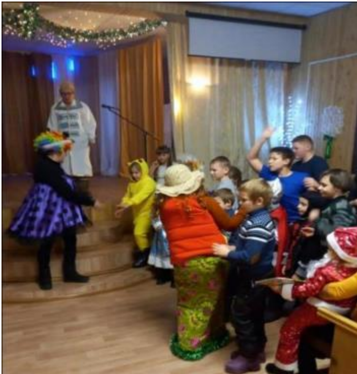
Игра попади в мишень

Дети играли веселились, были различные игры, водили хоровод с Дед морозом и Снегурочкой. После все получили сладкие подарки, не кто не остался без внимания.