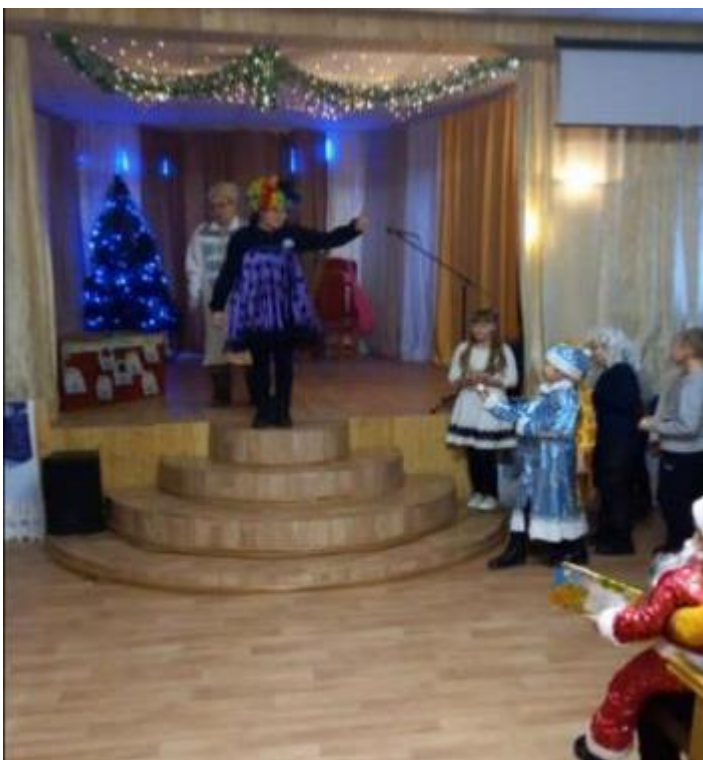
Кикимора объясняет детям как играть.