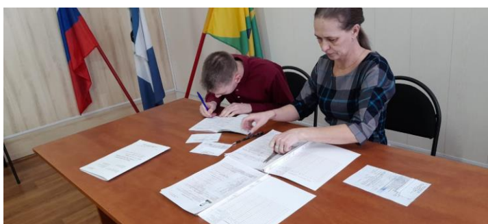
Подготовила: Инспектор ВУС: Литвинцева А.В.