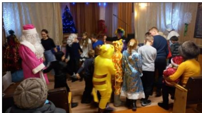
Какой ребенок не любит смотреть мультфильмы? Сегодня жизнь ребят сложно представить без них. Милые,

очаровательные, смешные, веселые, добрые, поучительные герои мультфильмов. Их любят не только дети, но и взрослые.