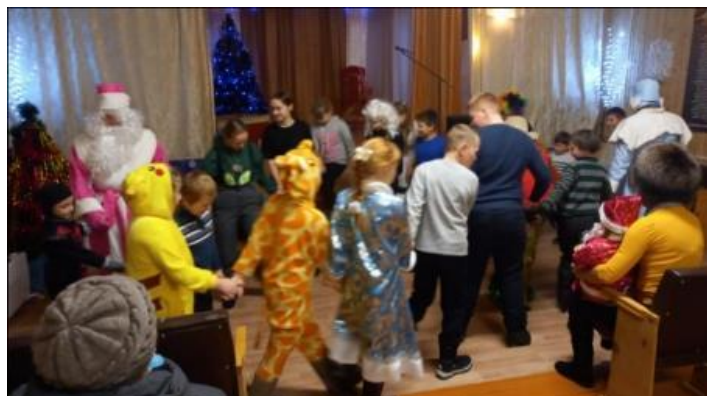
Игры с дед морозом.