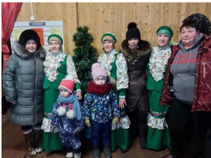
Гости и участники концерта.

Конечно, наши ребята еще не достигли в игре больших успехов. Но все впереди.