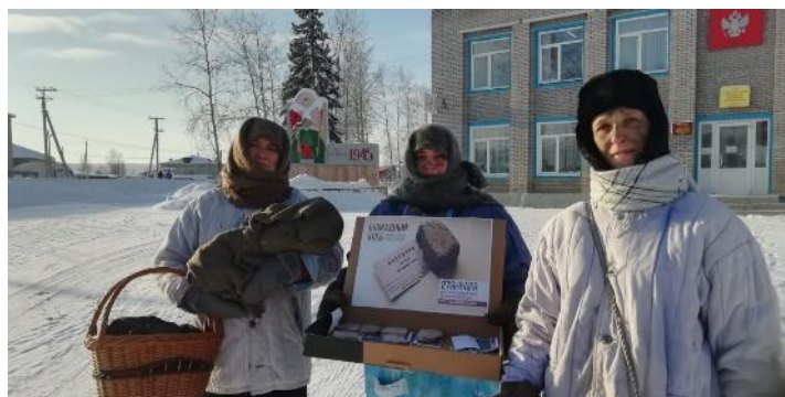
Подготовила: специалист по молодежной политике и спорту администрации БСП - Белоглазова В.А.