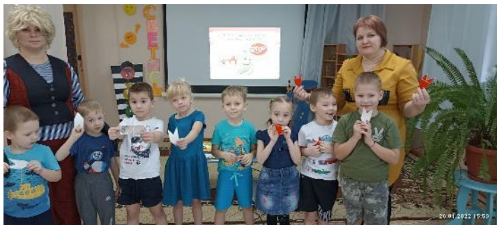
Материал подготовила: воспитатель д/с «Ручеёк» Костырева Т.В.