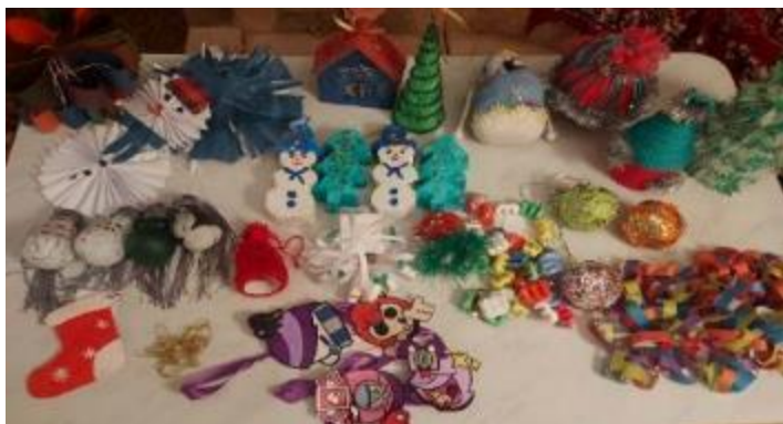
Вот такую красоту сделали наши детки.

Цель конкурса –это создание условий для творческой активности всех участников, создание праздничной, волшебной новогодней атмосферы. Дети проявили творчество, фантазию и мастерство. Рисунки и новогодние игрушки поражали своей неповторимостью и яркостью. Все дети, которые участвовали получили грамоты, дипломы, сладкие подарки. Всем большое спасибо за участие.