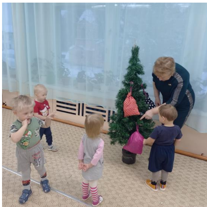
Материал подготовила: воспитатель д/с «Ручеёк» Костырева Т.В.