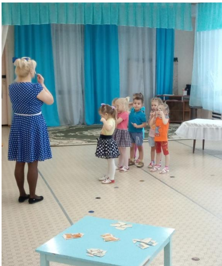
Материал подготовила: Молчанова Н.Н.