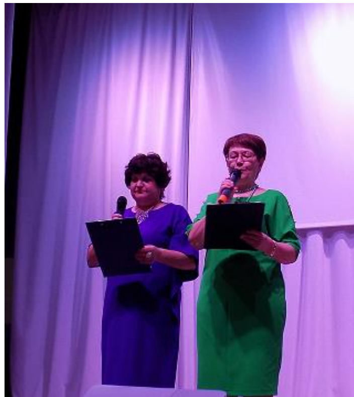
На мероприятие были приглашены ветераны, труженики тыла и жители поселков Березняки и Игирма.

3 февраля 1975 года было распоряжение председателя Березняковского сельского совета о создании Совета ветеранов п. Березняки и п. Игирма. 16 февраля 2020 года в 14.00. в МУК «КИЦ БСП» был организован праздничный концерт, посвященный 45- летию Совета ветеранов.