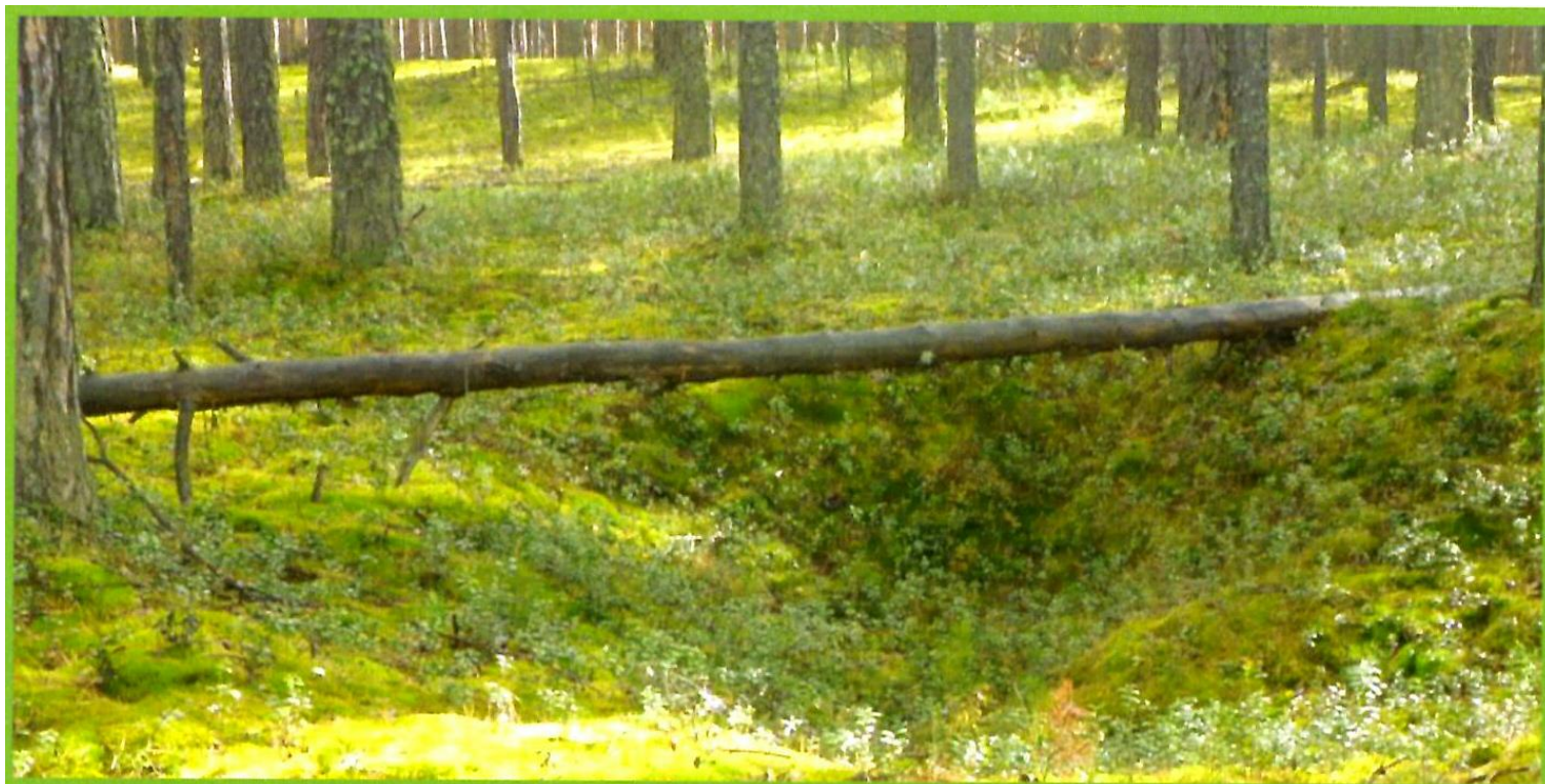
Изображение № 3