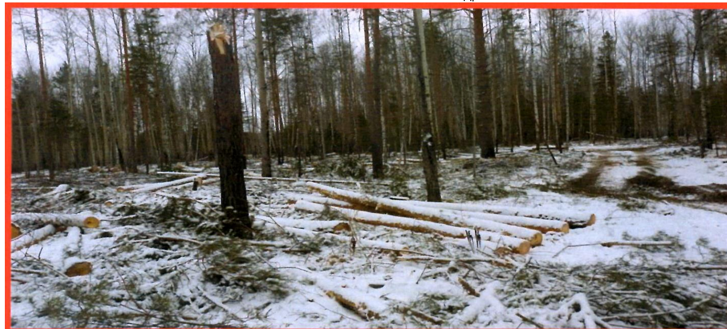
Изображение № 6 Заготовленная Древесина на лесосеке. Не является валежником

Оставленные на лесосеке срубленные хлысты, бревна, старые штабели, являются собственностью арендатора лесного участка, соответственно забрать такую древесину нельзя (смотри изображения JV2 6, 7).