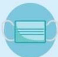
Носить маску и менять ее каждые 2 часа