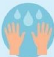
Мыть руки как минимум 20 секунд