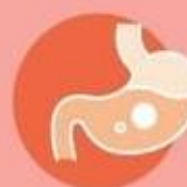
Проблемы с ЖКТ у детей