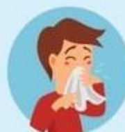
Близко не находиться с чихающими и кашляющими людьми