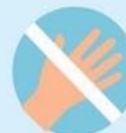
Не трогать глаза, рот и нос немытыми руками