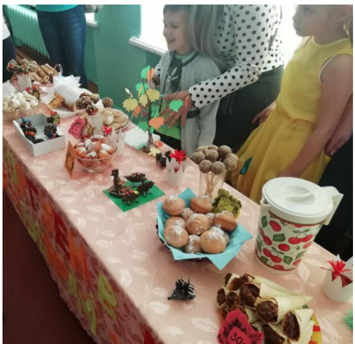
Подготовила: Педагог-организатор Оглоблина В.И.