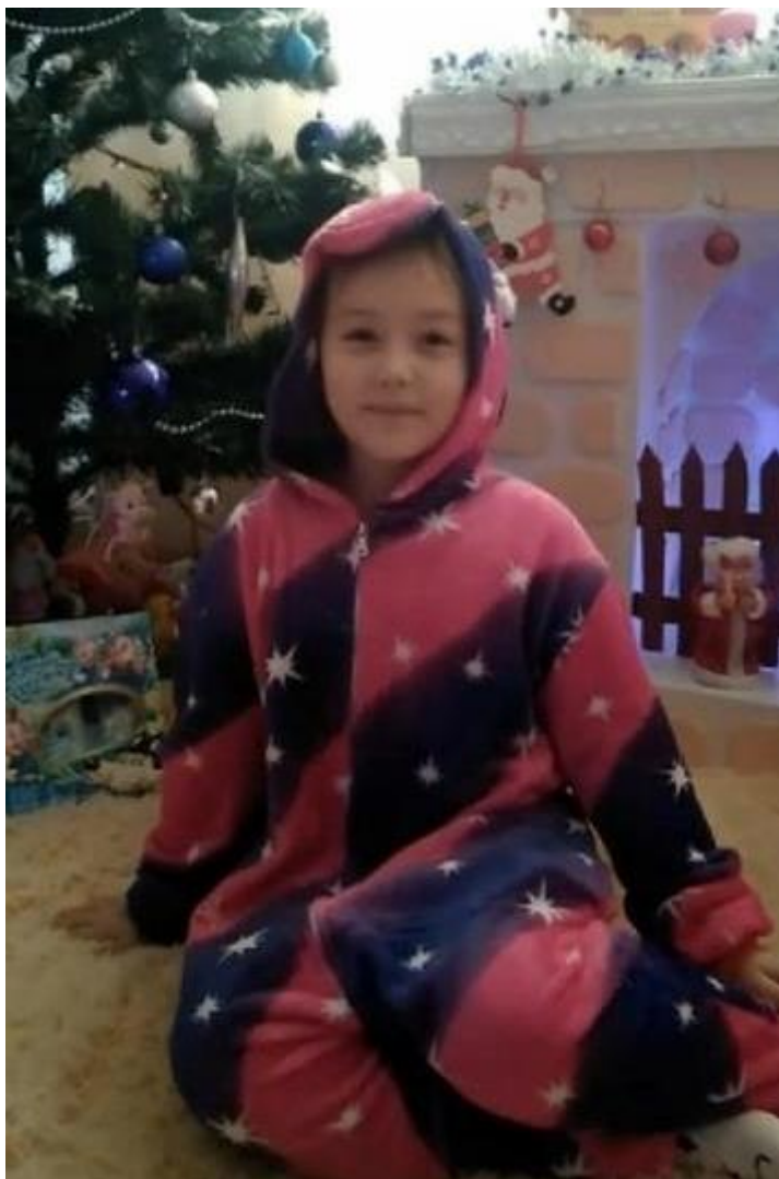
Игра «Кабы не было зимы» в музыкальном клубе «КАМИН»

Два года существует в СДК клуб любителей песен. В 2020 году заседания клуба пришлось перенести в режим онлайн. Знатоки музыкального творчества продолжают играть и побеждать в музыкальных играх.