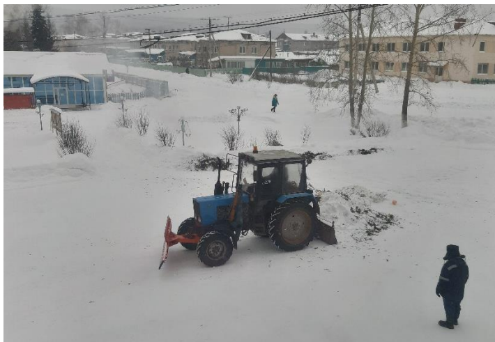
Подготовил: Соловьёв С.Н.