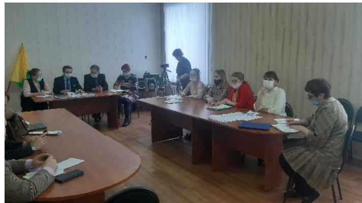
Подготовил: Соловьёв С.Н.

Составлен план «Дорожная карта» по решению некоторых вопросов.